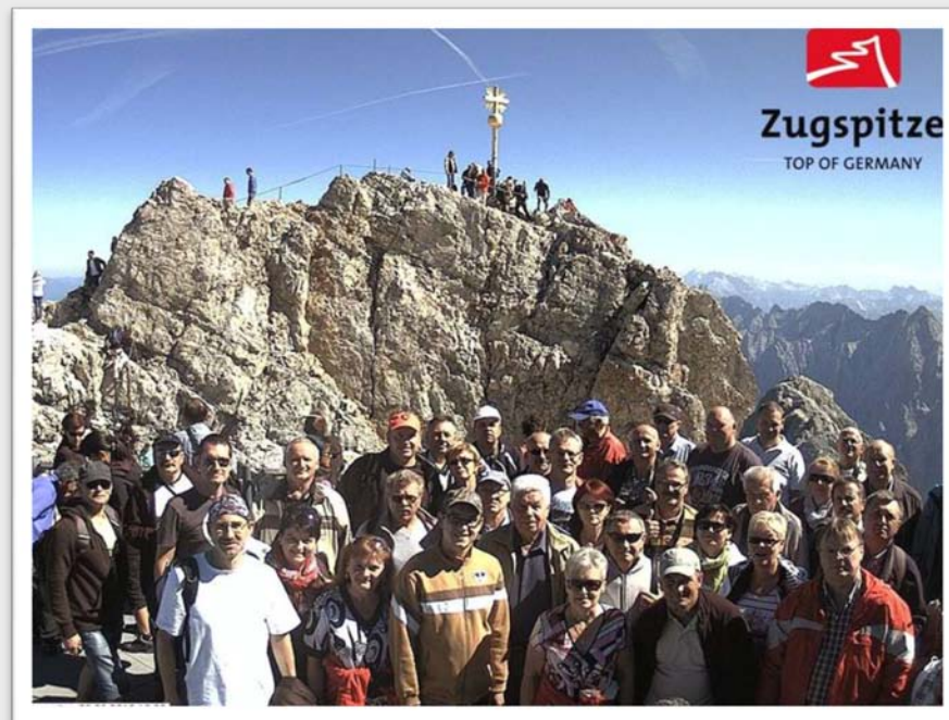
Uczestnicy wycieczki na najwyższym szczycie Alp Tyrolskich - Zuspitze 2962 m n.p.m