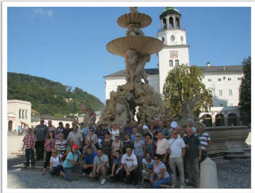
Plac Rezydencji w Salzburgu