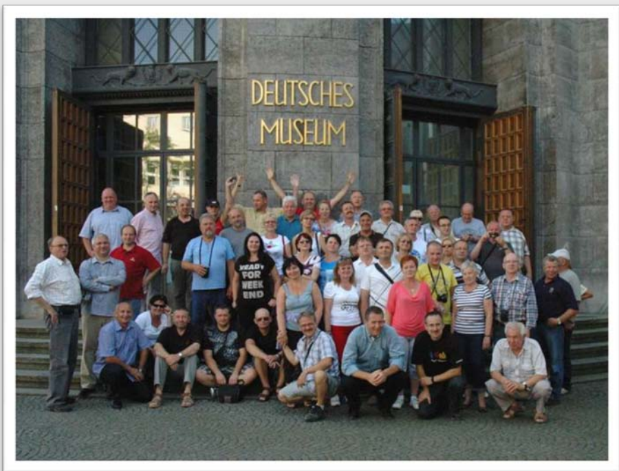
Uczestnicy wycieczki przed Muzeum Techniki w Monachium