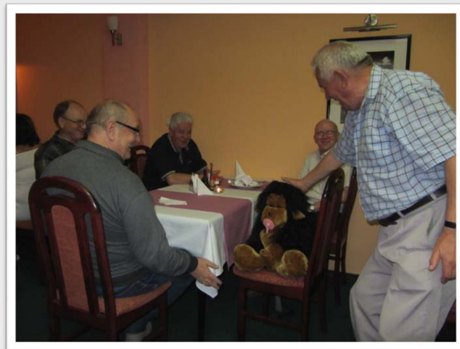
No i mieli okazję zaprzyjaźnić się z małą małą