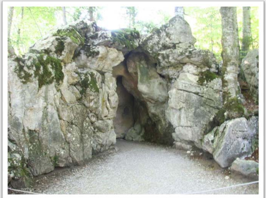
Jaskinia niedaleko zamku Linderhof, która jako pierwsza w Bawarii miała oświetlenie elektryczne