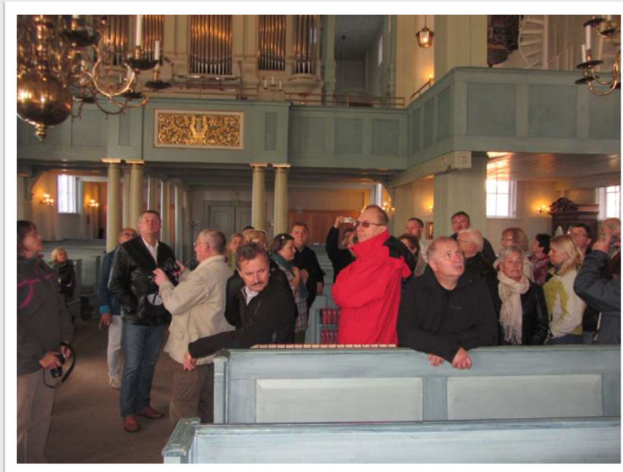
Kościół Admiralicji w Karlskronie

W kolejnym etapie uczestnicy wycieczki udali się promem szwedzkiego armatora Stena Vision do Karlskrony