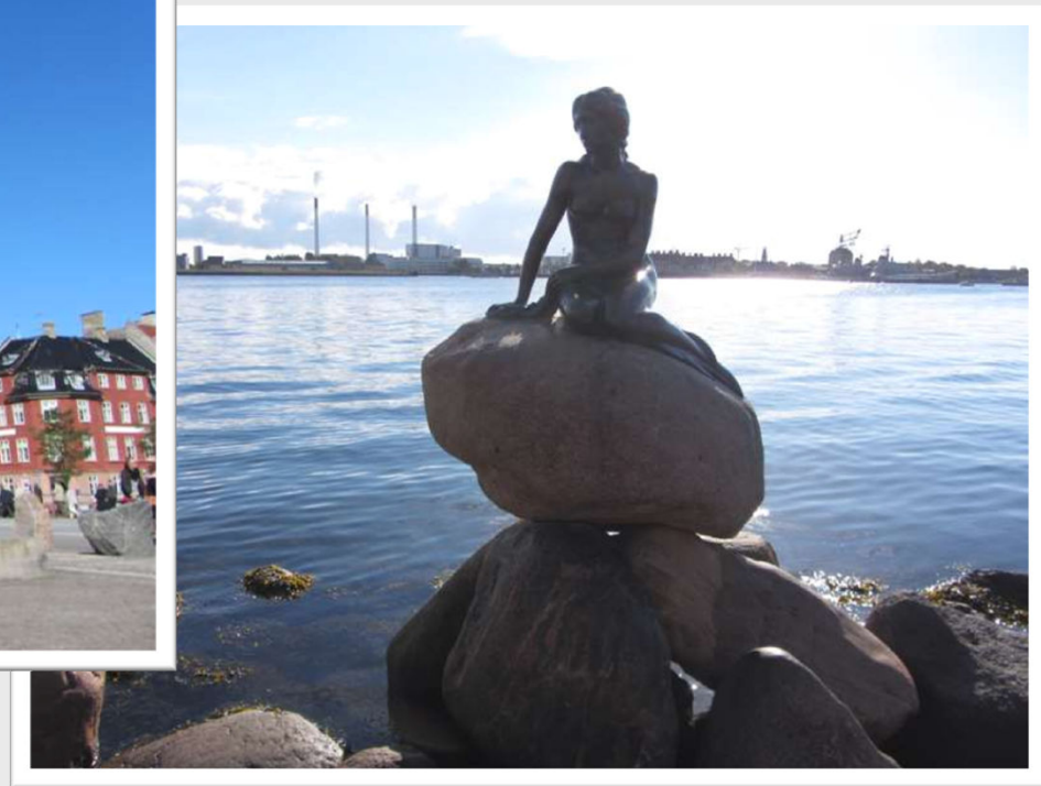
Zdjęcie Małej Syrenki - symbolu Kopenhagi