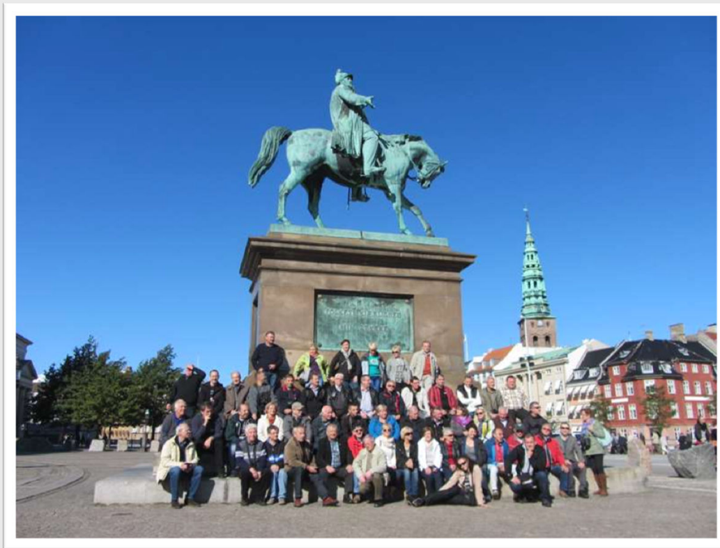
Pod pomnikiem króla Fryderyka VII przed Pałacem Christiansborg w Kopenhadze