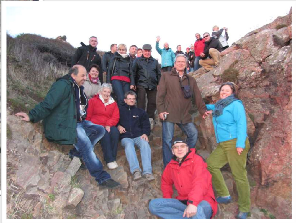
Nad skalistym brzegiem w Rezerwacie Przyrody Kullaberg