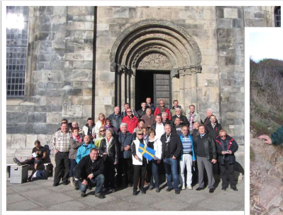
Nasi koledzy na tle romańskiej katedry w Lund